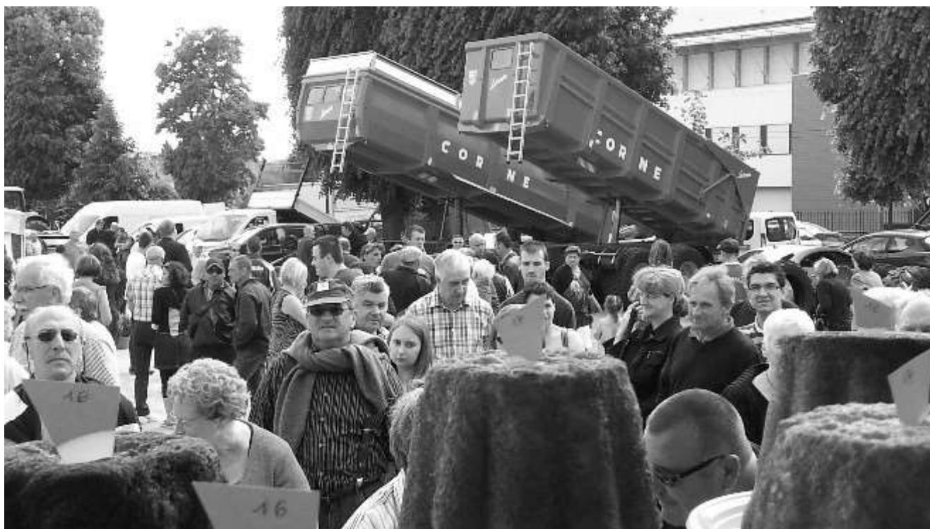
Le Festival de l'Agriculture en Picardie Maritime rassemble à chaque édition, 20.000 visiteurs.